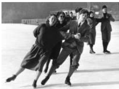
Het stijlvolle schoonrijden. Hier in Amsterdam in 1985.

De ijsvereniging schreef wedstrijden uit. Dat waren verschillende soorten in een bepaalde volgorde. Eerst waren er de schoolwedstrijden, waarbij de laagste klassen nog lopend over het ijs gingen. Dan de enkelwedstrijden over 160 meter sprint, een lange baan (vier