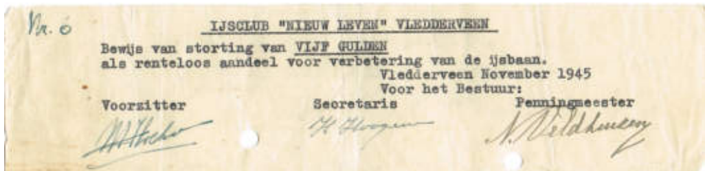
Aandeel nummer 6.

geruststellend antwoord dat de kans groot is dat de Mannespoel in zijn huidige vorm behouden zal blijven.