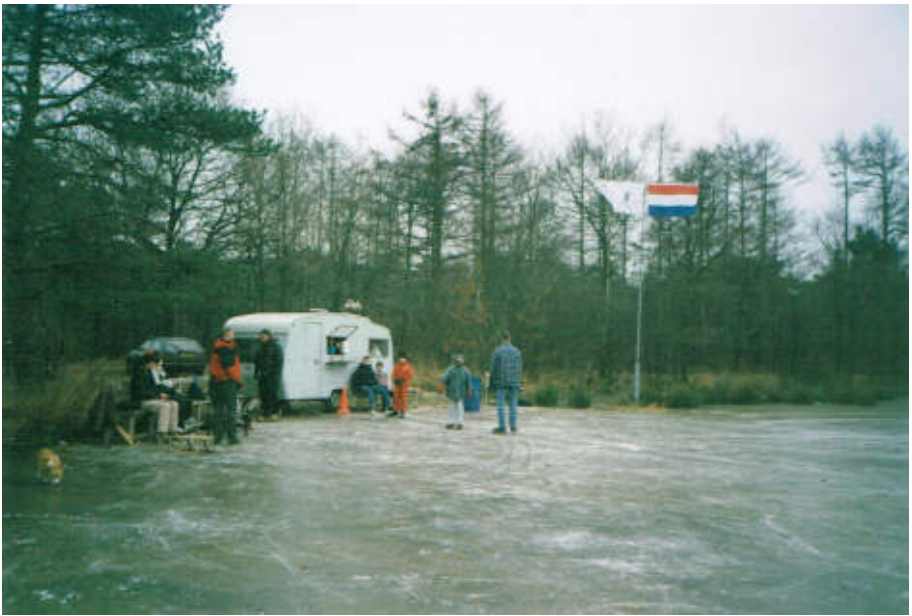
De trouwe koek-en-zopie caravan.

animo onder de volwassenen voor de kortebaanschaatswedstrijden af en het aantal kinderen in het dorp ook. In het seizoen 2006/2007 werden de laatste wedstrijden voor kinderen gehouden, maar omdat de aantallen per leeftijdscategorie klein waren, moesten groepen met grotere spreiding in de leeftijden gemaakt worden. Om toch het verschil in leeftijd mee te laten wegen werd een handicap ingevoerd. De “oudere” deelnemer van het paar werd dan op bij voorbeeld 10 meter achterstand gezet. De laatste winnaar bij de jeugd die in de annalen van de vereniging bijgeschreven kon worden was Berend de Jonge. Hiermee kwam dus een (wellicht voorlopig?) einde aan 80 jaar wedstrijdschaatsen in Vledderveen.