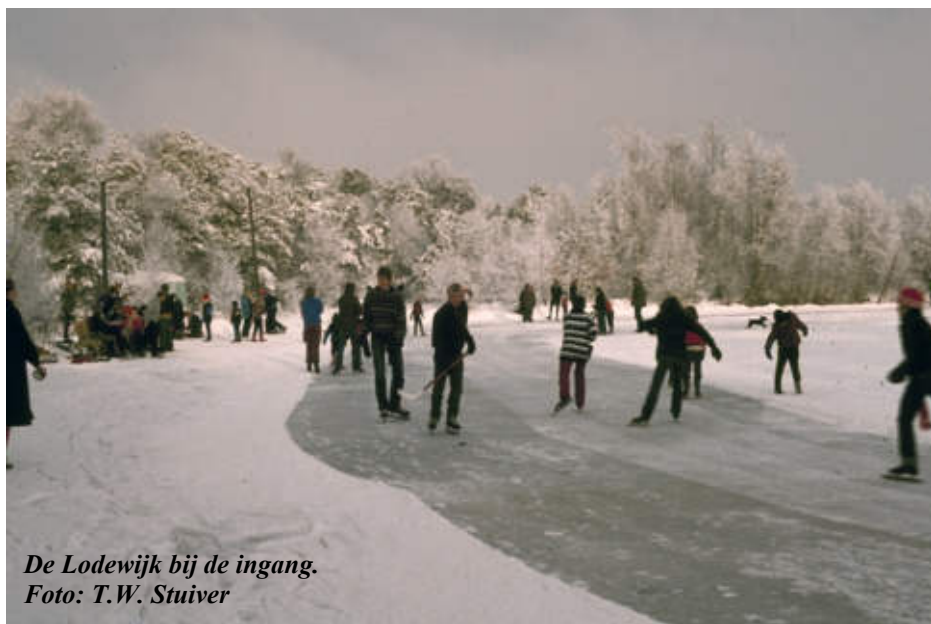
De Lodewijk bij de ingang.

(Dank aan Bertus Kok en Berend Trompetter)