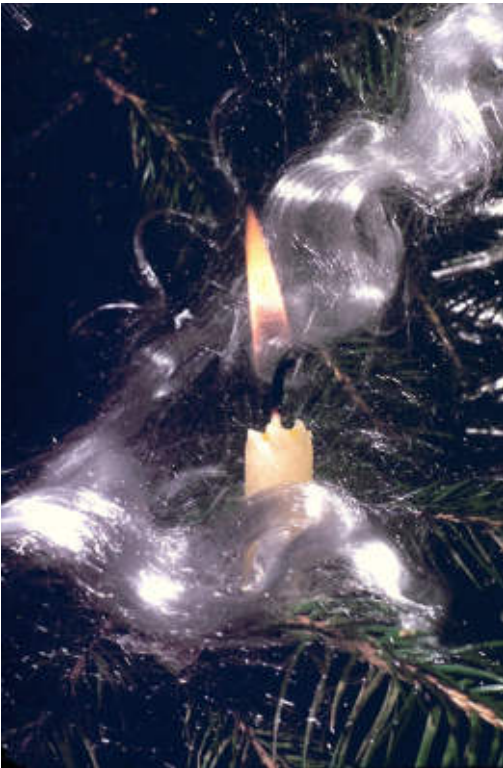
Kaarsjes in de kerstboom was in de jaren 50 en begin jaren 60 nog goed gebruik.

Op school maakten wij voor het kerstfeest bij het vak handenarbeid kaarsenstanders en kerstkaarten. Een week voor de kerst begon bij ons thuis de verhuur van kniepertjesijzers, mijn vader had er twaalf in de verhuur. Bij veel gezinnen werd er voor de laatste dagen van het jaar nog kniepertjes gebakken.