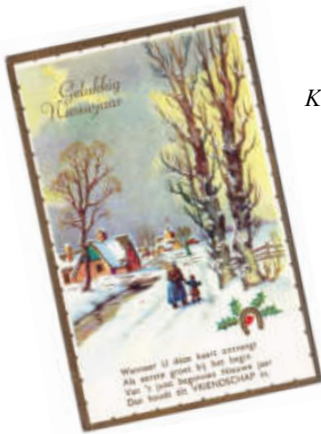
Kerst- en Nieuwjaarskaarten