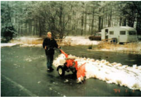
De essentiële attributen voor de ijsvereniging.

omdat “ Samen Een ” inmiddels gesloten was. Deze feestavond was aangemeld bij de gemeente (leges f 3,00). “ De Molenwiekers ” verzorgen de muziek en de conference à raison van f 350,00. 's Middags was er al een kinderfeest met consumpties en samen met alle consumpties van het avondfeest moest de vereniging hiervoor f 493,45 betalen.