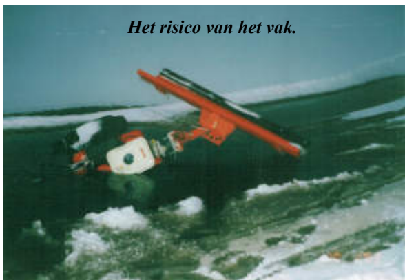
Het risico van het vak.