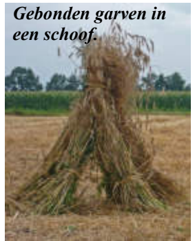
Gebonden garven in een schoof.